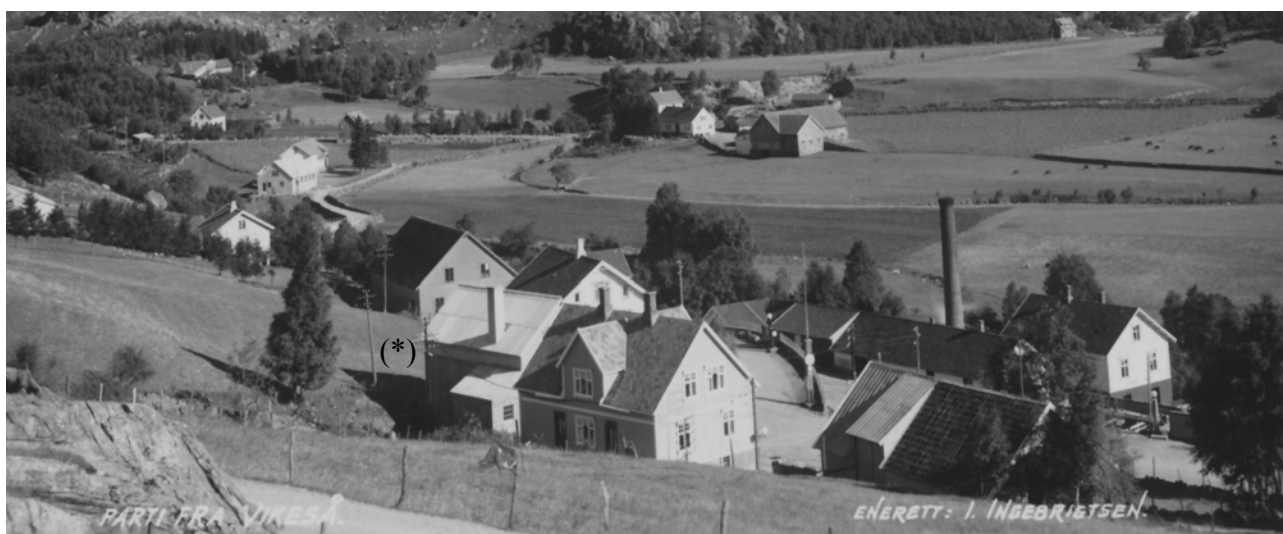
Her (*) over Bubekken ser me den fyrste bygdemølla i Bjerkreim, bygd i 1938. Den brann ned i 1943.