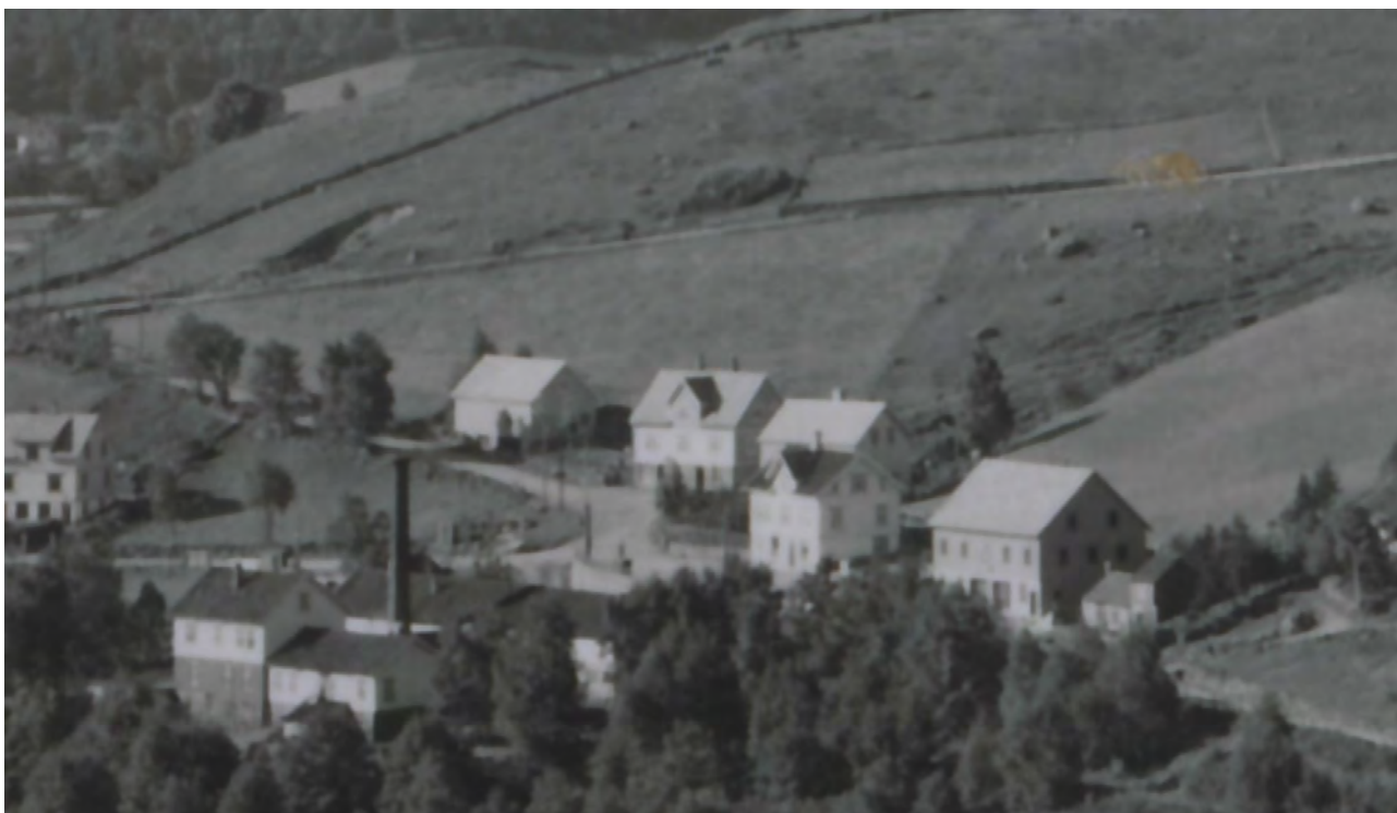
Bilde av den gamle mølla rett over Bubekken. Her ser me også at tomta for den nåværende mølla ikkje er utgravd.