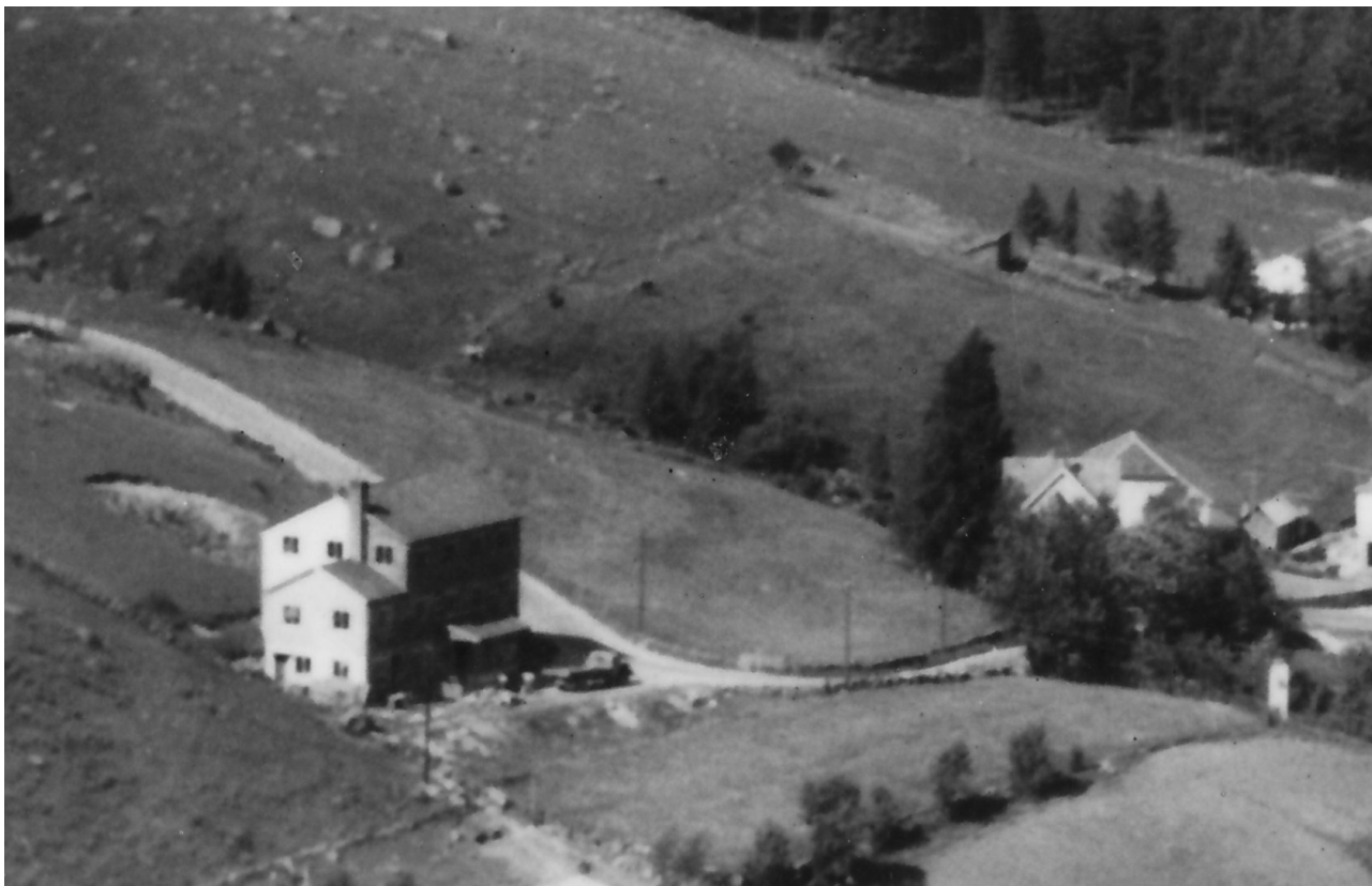
Nåværende mølle i Møllesvingen, bygd 1943.