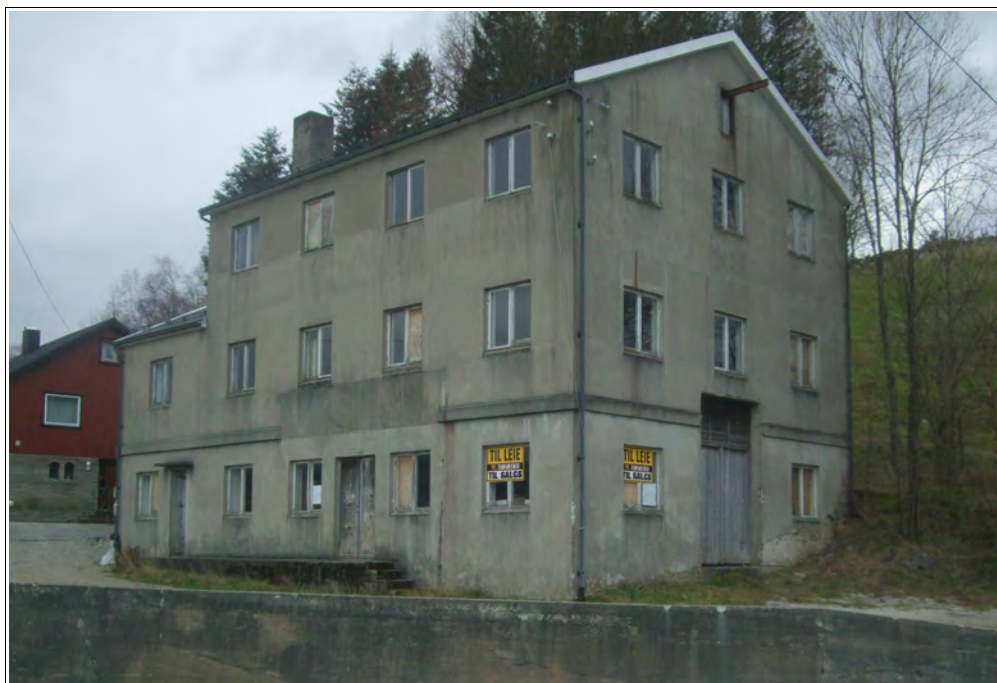
Bjerkreim Bygdemølle, Vikeså, slik den framstår i dag (2014)